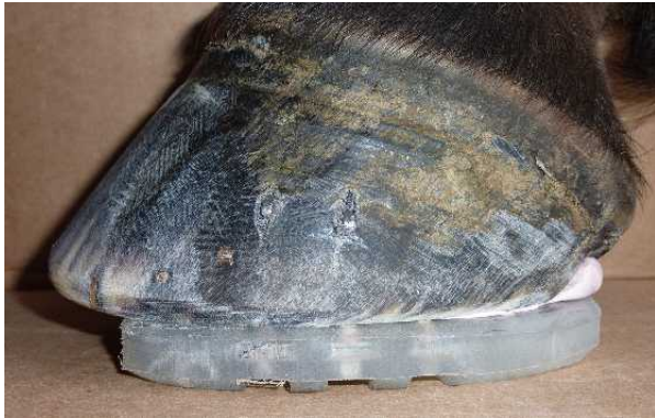
Abbildung 8: Fertiger Beschlag

Die Hufzehe ist nach dem Vernieten stark zu berunden, dabei dürfen aber keine abrupten Radienübergänge am Hufumfang entstehen.