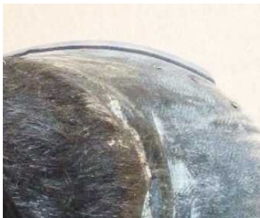
Abbildung 6: seitlicher Überstand - Markierung zum Schleifen

Am hinteren Steg ist bodenseitig eine Trachtenrichtung anzubringen, die etwas vor den Trachtenenden beginnt.