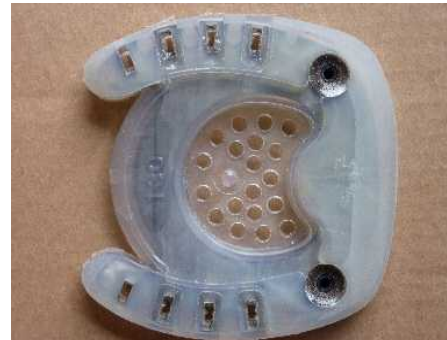
Abbildung 8: fertig geschliffener Beschlag mit Trachtenrichtung