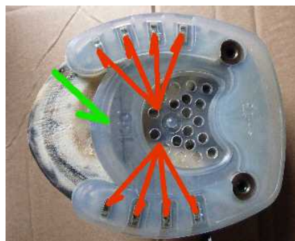
Abbildung 4: Position Metallkern (grün) und Nagelgesenke (rot)

Die richtige Beschlagsgrösse wird ausgewählt, indem der vordere Steg mit dem Metallkern in die jeweils passende Position zum Hufbeinrand (s.o.) gelegt wird. Dabei müssen die Nagelgesenke über der weissen Linie der Wand liegen.