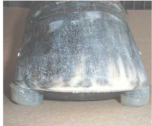
Abb. 9: Weiche Radienübergänge!