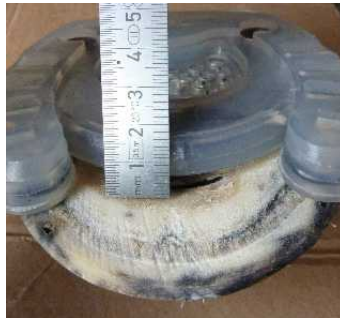
Abbildung 5: Abstand Sohle - Steg

Ist dies nicht der Fall, beispielsweise bei sehr flacher Sohle, kann die Kunststoffhebung des Steges flach geschliffen werden. Auch von vorne kann der Steg bis kurz vor den Metallkern zurückgeschliffen werden. Dabei ist jedoch darauf zu achten, dass zur Hufsohle hin keine Kanten oder punktuelle Vorsprünge entstehen, der Steg muss sich quasi in die Sohle „einschmiegen“.