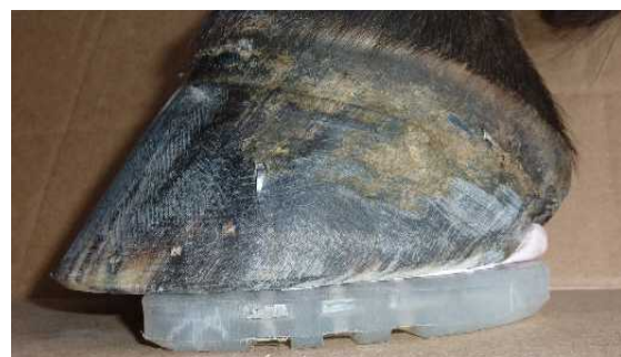
Abbildung 7: mit 2 Nägeln fixiert...