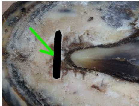
Abbildung 1: Markieren der Hufbeinspitze am Sohlenhorn