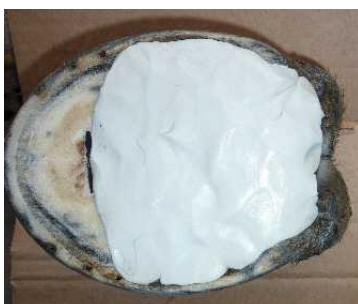
Abbildung 6: Abmessen der richtigen Polstermenge