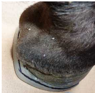
Abbildung 7: Anzeichnen Trachtenüberstand